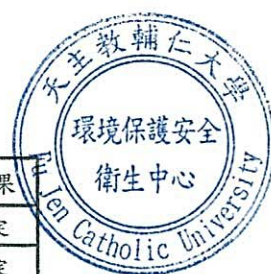
輔仁大學水質檢驗結果一覽表